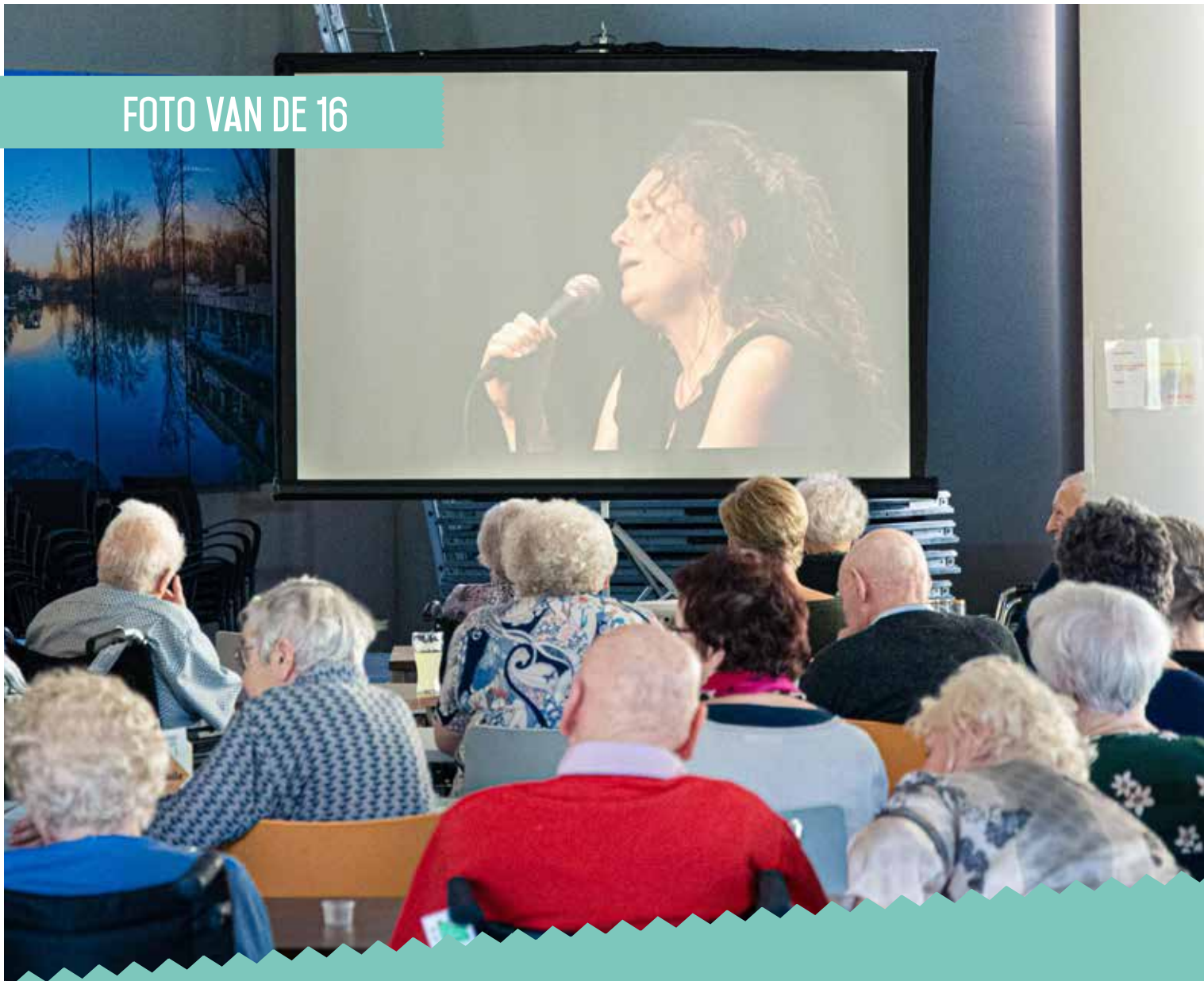
FOTO VAN DE 16