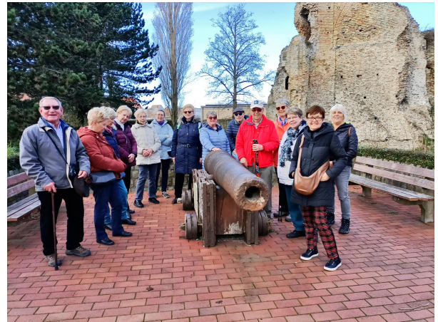
Wandelnamiddag in Nieuwpoort