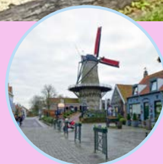
DAGUITSTAP OOSTAKKER - SLUIS