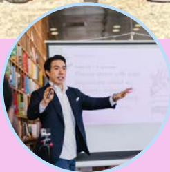
LEZING ERFENIS SCHENKINGEN