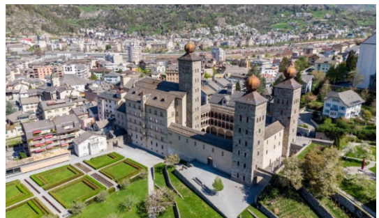
Wallis Brig 12-19/9/'22

Wel vooraf laten weten of U komt meegenieten, bij: